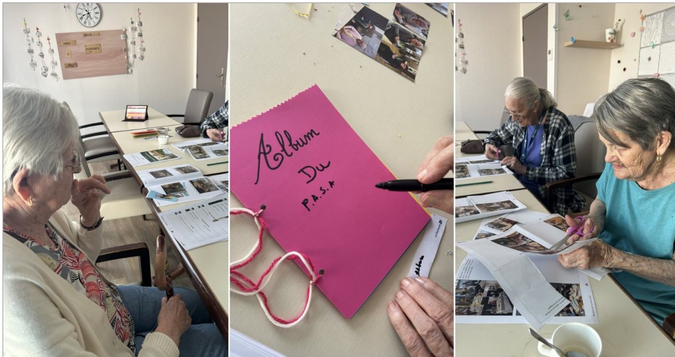
Au P.A.S.A nous créons notre album photo