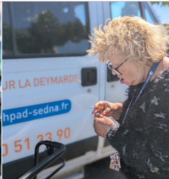
Mme P. a bravé le vent avec une dernière cigarette