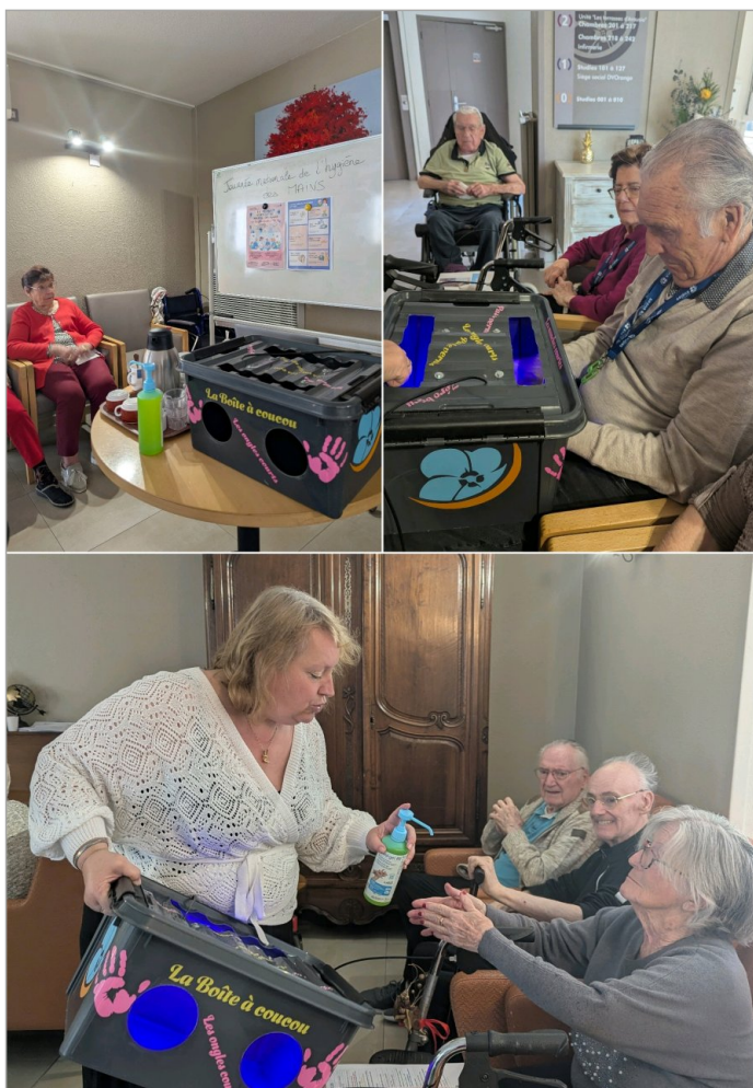
5 mai : journée nationale de l'hygiène des mains .En collaboration avec notre infirmière qualicienne , nous avons participé à un café-jeu sur le thème