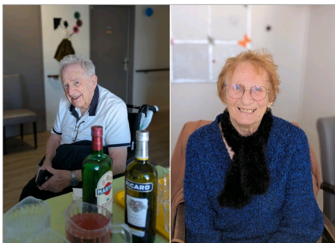
Le Repas spécial du WE s est deroulé au PASA. Et c'est l'heure de l'apéro !