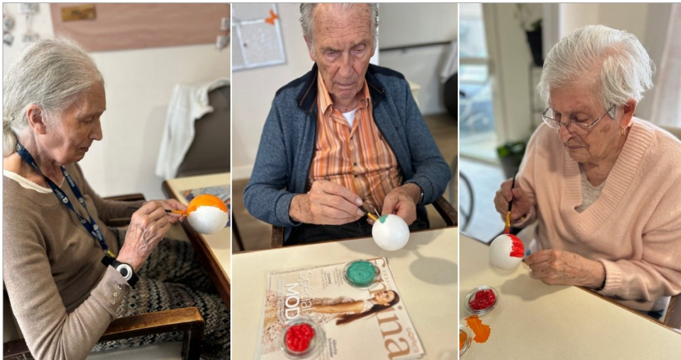
Ce lundi, c'est peinture au PASA