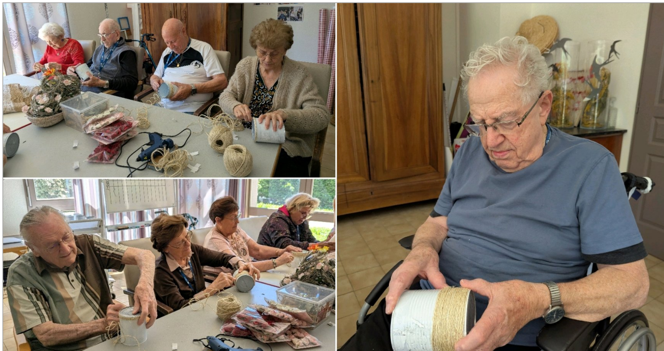
En mode préparation de la décoration de notre garden party qui aura lieu le 25 mai