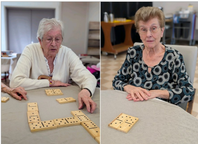
Notre table des dominos du jour