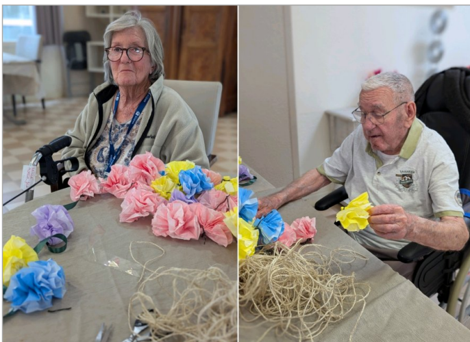
Et pour ceux qui préfèrent , en parallèle il y a souvent une activité manuelle .