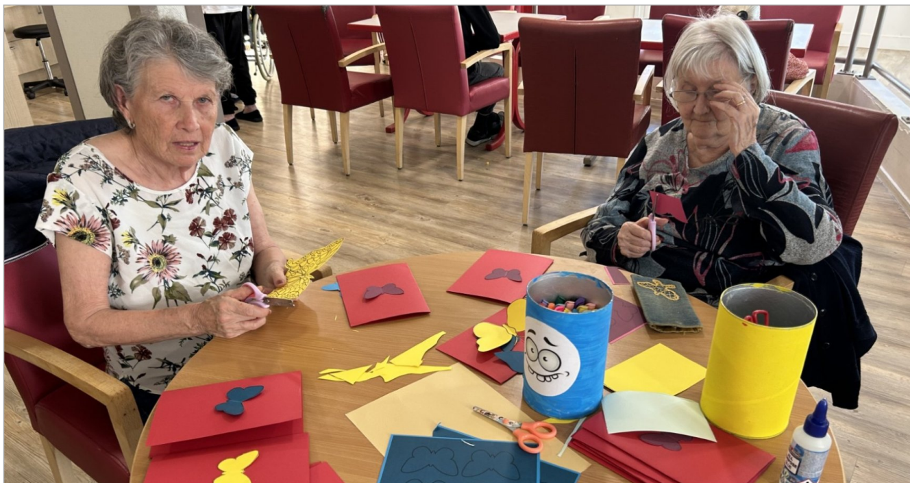
Mme M. et Mme H. sont en pleine activité manuelle