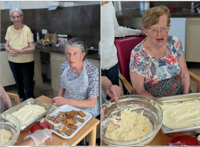
Samedi 30 mai : on prépare un tiramisu pour dimanche ;-)