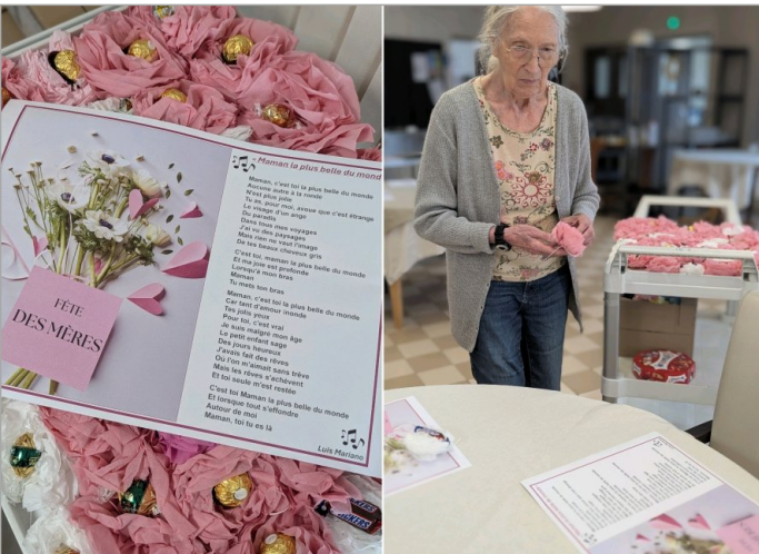
Dimanche 31 mai , c'est la fête des mères . Mise en place des décorations de table