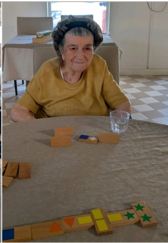
Une autre table jouait aux dominos de couleur