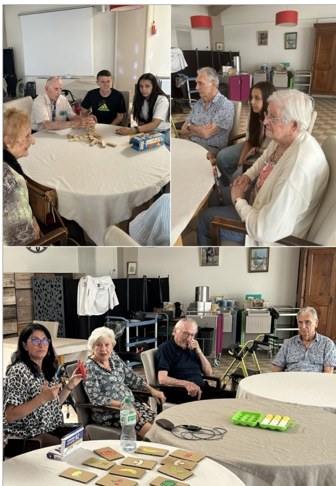
Merci au Lycée de l'arc pour ces bons moments de partage!