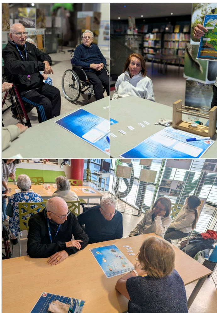
Mardi 12 mai , sortie à la médiathèque d'Orange